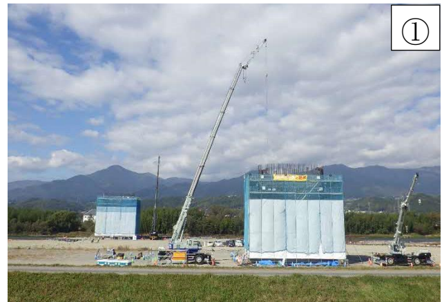
河川内の橋脚工事

※本線工事のヤード等として、一部の土地を借地して使用させていただきたいと考えております。ご協力いただきたい方にはご相談に伺います。