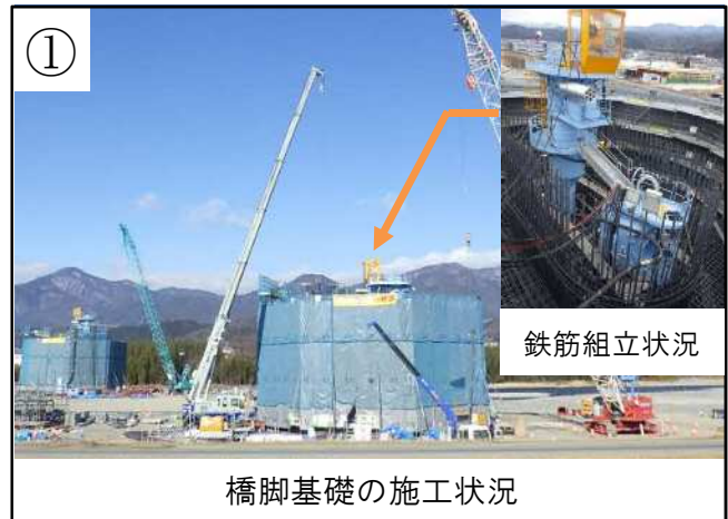
橋脚基礎の施工状況