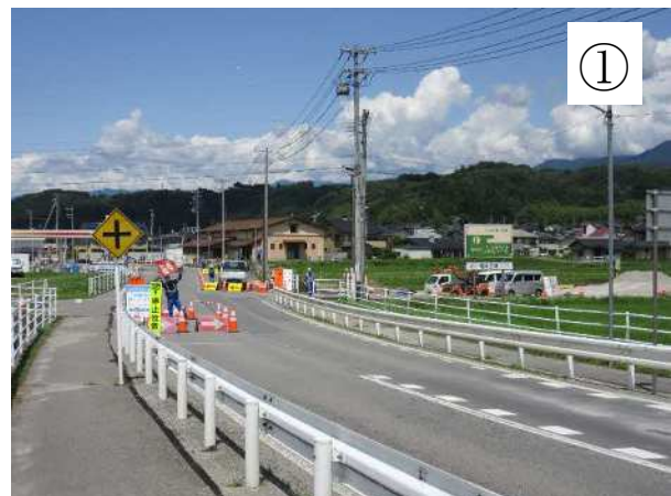
高架橋施工ヤード整備工