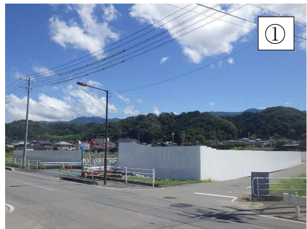
高架橋施工ヤード整備状況 (R4.9.6 現在)

※本線工事のヤード等として、一部の土地を借地して使用させていただきたいと考えております。ご協力いただきたい方にはご相談に伺います。