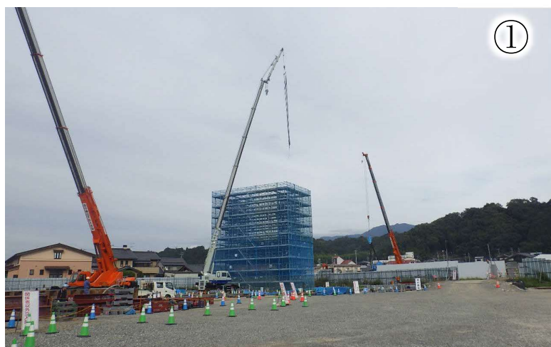
竜東一貫道路東側の高架橋工事

※本線工事のヤード等として、一部の土地を借地して使用させていただきたいと考えております。ご協力いただきたい方にはご相談に伺います。