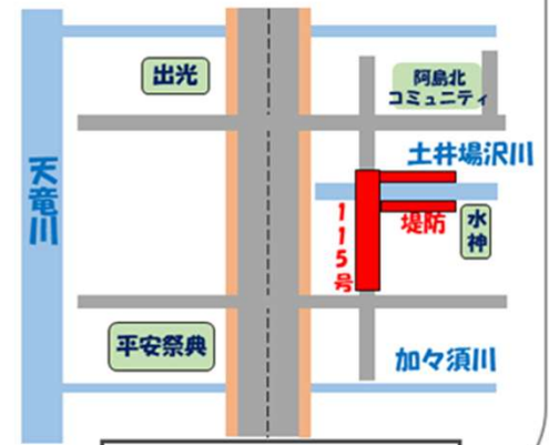
村道115号付近交通規制箇所詳細 (9月下旬~R7年冬頃)