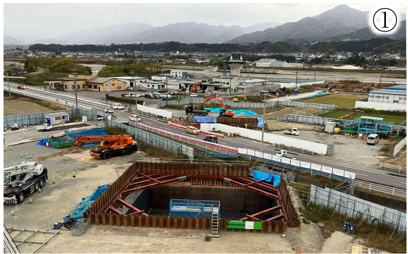
高架橋基礎工事の様子

※本線工事のヤード等として、一部の土地を借地して使用させていただきたいと考えております。ご協力いただきたい方にはご相談に伺います。