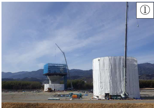
河川内の橋脚、上部工工事

※本線工事のヤード等として、一部の土地を借地して使用させていただきたいと考えております。ご協力いただきたい方にはご相談に伺います。