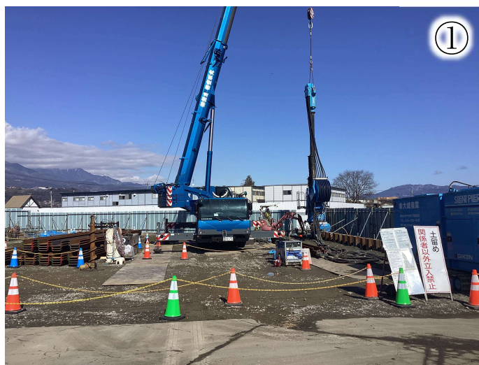
鋼矢板打設の様子

※本線工事のヤード等として、一部の土地を借地して使用させていただきたいと考えております。ご協力いただきたい方にはご相談に伺います。