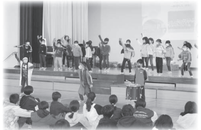
3月 6年生を送る会(3月8日)

2月には、5年生が麦踏みを行いました。指導してくださったJ A女性部のスピカの皆さんから、「もっと力強く踏んだ方が良く育つんだよ。」と教わると、みんなで楽しみながら、ギュッ、ギュッと麦畑を踏んでいきました。初夏の収穫が楽しみです。