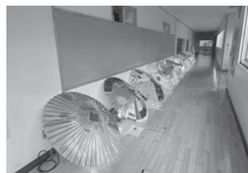
喬木村第一小学校卒業式