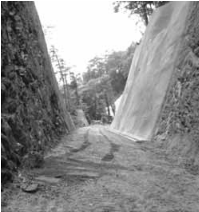
険しい山中を切り開き林道建設が進められています。(大島工区)

編集 企画財政室／発行 喬木村役場 TEL 0265-33-2001 FAX 0265-33-3679 印刷 龍共印刷株式会社 (飯田市上郷黒田121-1)