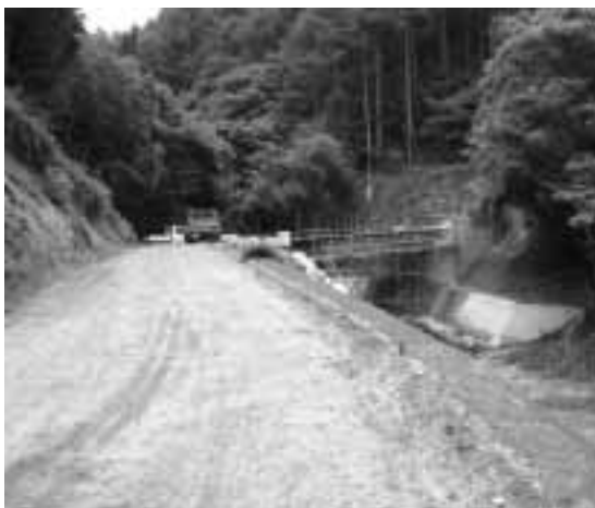
鬼ヶ城沢川上流の架橋工事(氏乗工区)

工事区間は一年間に二〇〇mほどの整備がやっとと見られています。この林道完成には、山間地区の活性化に寄せる強い期待が込められています。特に大島地区は加々須川沿いの最上流域落となっており、地震や台風と言った大災害時に県道大島・阿島線が不通になる事態や、観光客等が通り抜けをして違う地域へ移動していけないと言った不利な地理的条件を抱えていることから、林道開通により氏乗経由で県道上・飯田線や三遠南信自動車道に繋がる効果に大きな期待を寄せています。