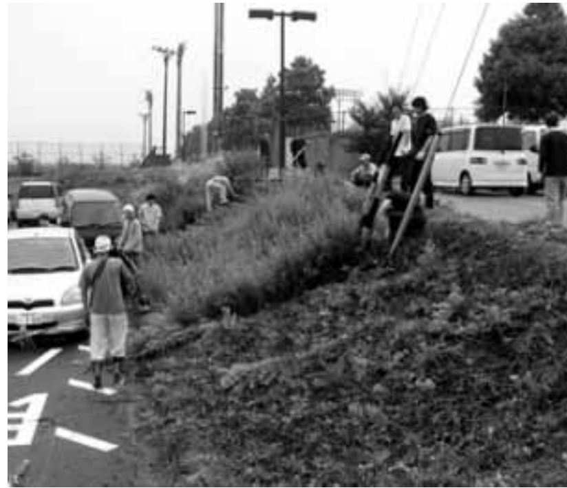
7月9日、140名が参加した運動公園環境整備

今年四月よりスタートした第四次喬木村総合振興計画の基本理念に据えた「住民が主役のむらづくり」を目指し、住民参加による協働の村づくりが各地で展開されています。今回は、それらの取組を紹介し、今後のさらなる活動発展に繋がりたいと思います。