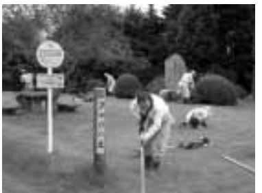
棕文学顕彰会の公園草刈作業(ふるさとの会)

昨年度コモンズ支援金を利用し、瀬戸の滝周辺の整備が村づくり塾や阿島・加々須区の協働事業で行われましたが、今年度もこの制度を利用し、矢筈の過誤除けの滝周辺整備や大島の菊目石出現箇所周辺整備などが地元地区の提案として事業化を目指しています。いずれも、地域資源を活用した活性化を目指す取組で、その一部を村や県が支援する中で、地域自治を促そうとする