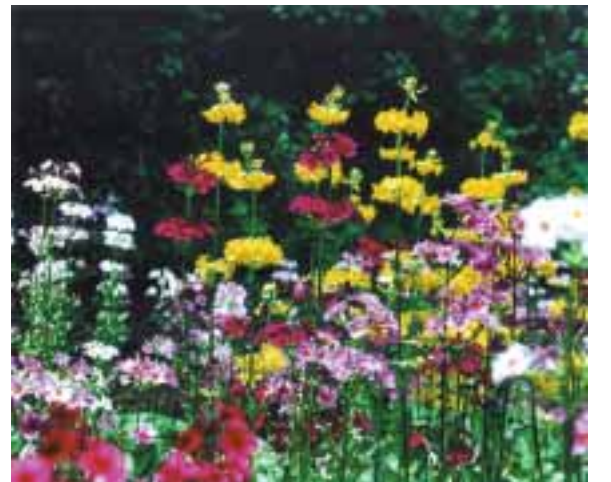
優秀賞「空をあおいで」 島井 千代(飯田市)