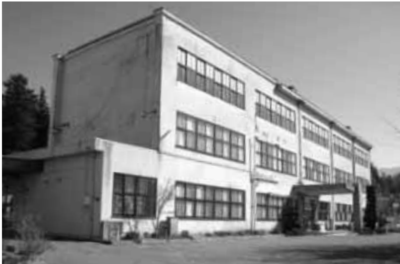
旧中学校舎を取り壊しグラウンドと合わせ災害避難施設設置場所を確保

編集 企画財政室／発行 喬木村役場 TEL 0265-33-2001 FAX 0265-33-3679 印刷 龍共印刷株式会社 (飯田市上郷黒田121-1)