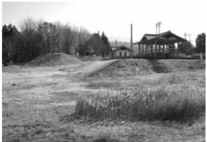
子育てふれあい公園が整備される運動公園北側広場

国に事業計画書を提出しました。事業計画の主なものは ○旧中学校々舎を取り壊し、災害避難施設設置のための場所を確保する事業 (六、〇〇〇万円) ○運動公園北側の広場に、子育てふれあい公園を整備する事業 (三、〇〇〇万円)