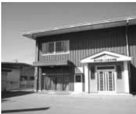
さくらの園が移転される第一社会体育館事務室

○障害者共同作業所・さくらの園を、第一社会体育館事務室の改築を行い移設する事業 (一、五〇〇万円) ○公用車として低公害車輜を購入する事業 (一、一〇〇万円) などとなっており、二年度事業で行う幹線村道の安全対策事業のための基金積立(三、〇〇〇万円)も行う予定です。