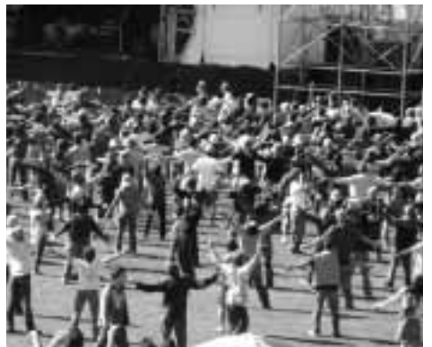
10月4日には特別巡回ラジオ体操を行ないまます

これからの地域づくりのための講座を連続して開催します。多くのアドバイザーから貴重なアドバイスを受けることができます。これからの村