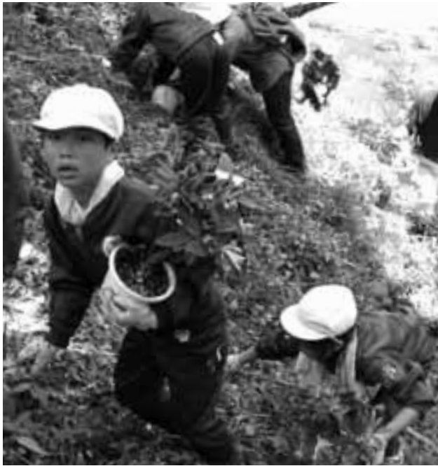
もみじの里づくりとして矢筈公園、鞍馬森林公園にもみじ約1,000本を植樹します

編集 企画財政室／発行 喬木村役場 TEL 0265-33-2001 FAX 0265-33-3679 印刷 龍共印刷株式会社 (飯田市上郷黒田121-1)