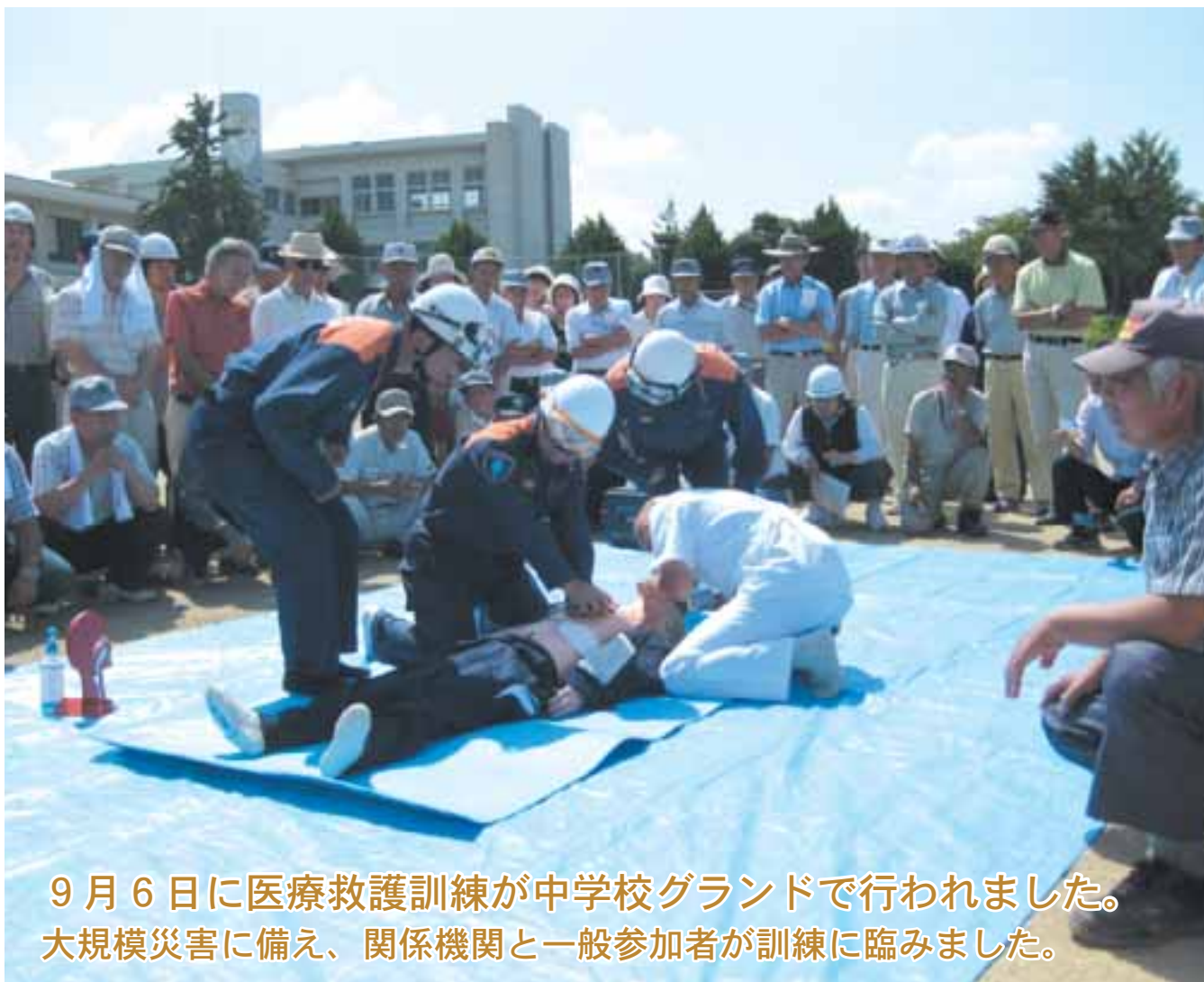
9月6日に医療救護訓練が中学校グラウンドで行われました。 大規模災害に備え、関係機関と一般参加者が訓練に臨みました。

ホームページアドレス http://www.vill.takagi.nagano.jp/ 電子メールアドレス info@vill.takagi.nagano.jp