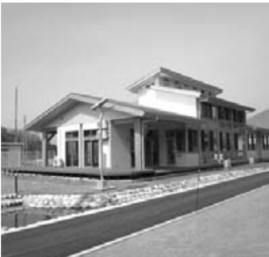
子育て支援の新たな拠点となる「こども学遊館」