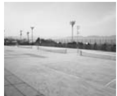
運動公園テニスコート改修