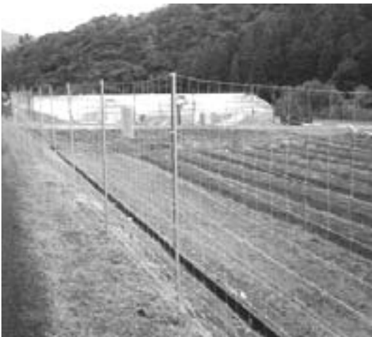
野生鳥獣防護柵設置