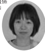
教育委員会 南保育園 福島 知恵