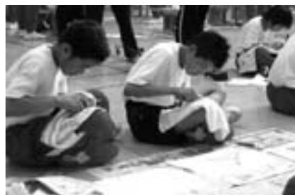
竹とんぼを作っています。