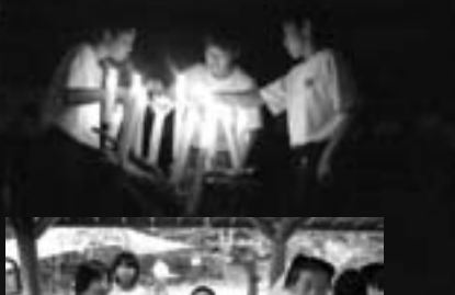
⑤「カレーは、うまいぜ！」

⑦キャンドルの集いので、協力・助け合い・団結の火を校長先生からいただき、中央に点火。