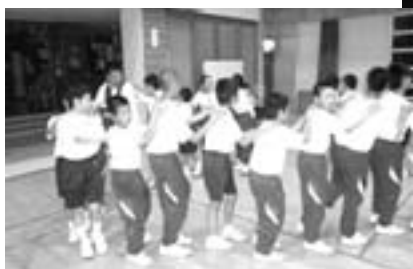
⑥雨のため室内でジェンカ。

⑦キャンドルの集いので、協力・助け合い・団結の火を校長先生からいただき、中央に点火。