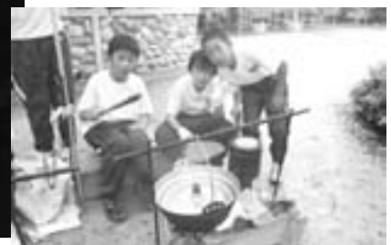
④雨が降ってきました。煙で目が痛いけど上手に火がおきました。「ご飯をこがさないように。」「大丈夫。まだ、焦げ臭くない。」「カレーは上々だ。」