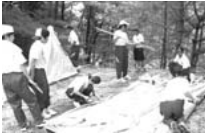
①まず、テントを広げる