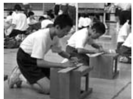
どうやれば貯金箱になるの？