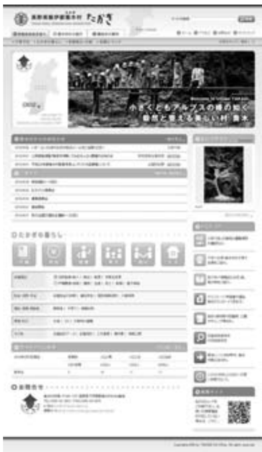
更新を行なった村ホームページ(トップ画面)

編集 企画財政課／発行 喬木村役場 TEL 0265-33-2001 FAX 0265-33-3679 印刷 龍共印刷株式会社 (飯田市上郷黒田121-1)