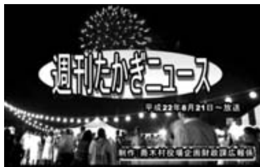
テレビ12チャンネルで放映している動画ニュース

今回の村情報発信更新事業の最終事業として、インターネットを使い村の情報発信を行っている村のホームページの更新を行いました。 今回の見直しで、統一感のある画面になり、見やすく使いやすいページに変更しました。