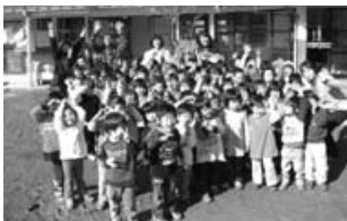
新しい年が良い年が来るように、みんなで記念撮影をしました。