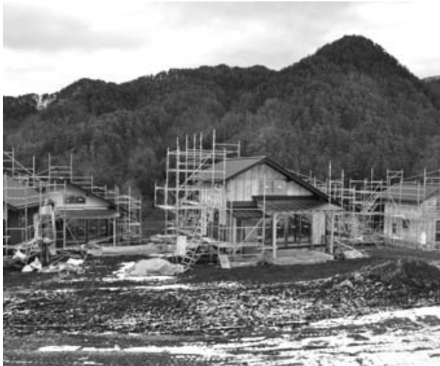
氏乗 クラインガルテン建設現場