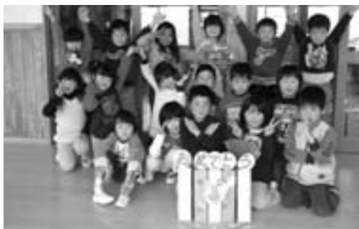
「あけましておめでとうございます。今年も元気に頑張ります」