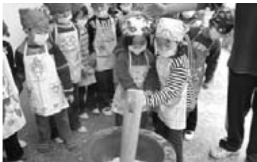
みんなでしっかいついたお餅おいしかったね!