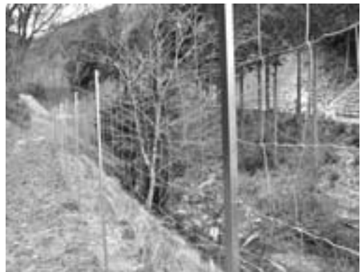
獣害防護柵設置箇所 (氏乗)

今年度取り組むクラインガルテン事業などによる新たな交流を起爆剤に、地域のあり方を村全体で検討を始めるきっかけとしたいものです。