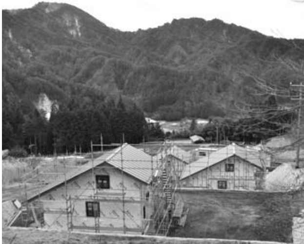
大島 クラインガルテン建設現場

今年度事業で取り組みを行っている、氏乗・大島地区のクラインガルテン建設工事が順調に進み、それぞれ建物の全容が確認できるようになりました。両地区とも居室の窓からは周辺の山並みをはじめ、勇壮な大自然を堪能できるように配置されています。昨年十一月からはパンフレットや村ホームページを使い募集