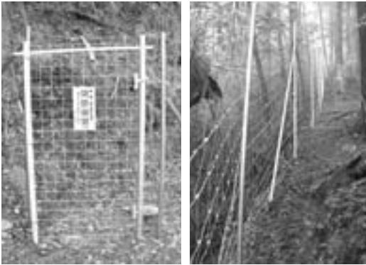
(約100mおきに門扉が設置されます)

喬木村、喬木村議会、8区及び自治会、財産区、JA、園協、森林組合、農業改良普及センター、農業委員会、猟友会、鳥獣保護委員