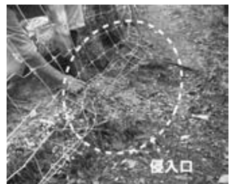
(柵外側にできた獣道と、地面の穴)