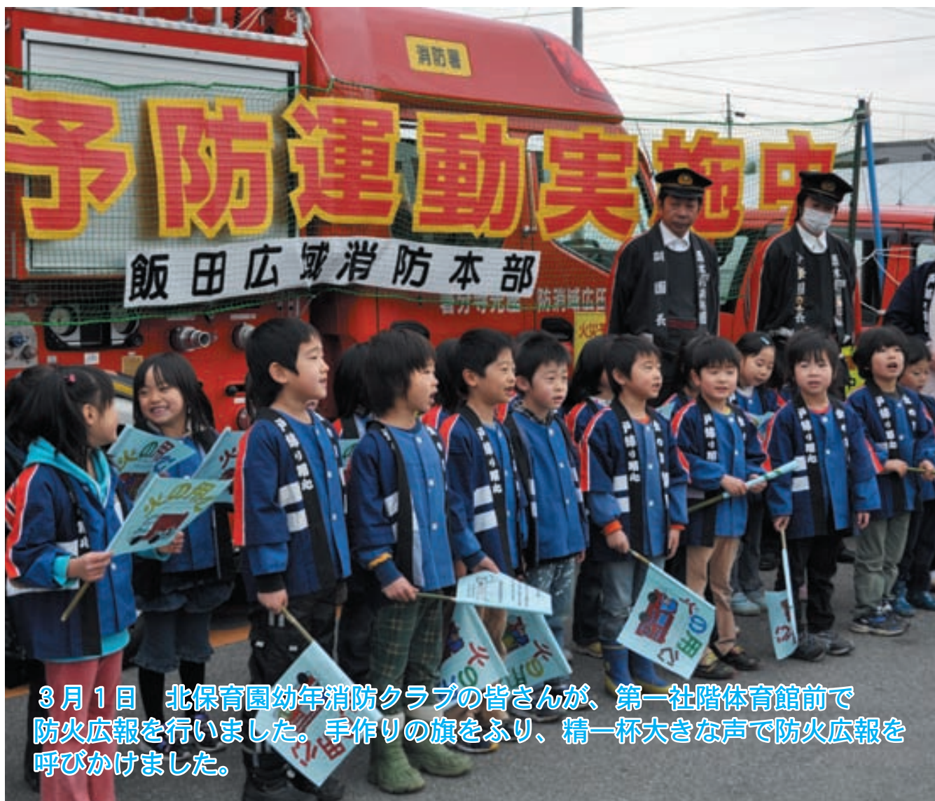
3月1日 北保育園幼年消防クラブの皆さんが、第一社階体育館前で防火広報を行いました。手作りの旗をふり、精一杯大きな声で防火広報を呼びかけました。

ホームページアドレス http://www.vill.takagi.nagano.jp/ 電子メールアドレス info@vill.takagi.nagano.jp