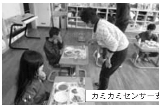
カミカミセンサー支援