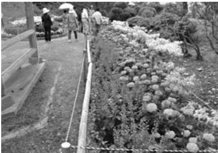
最優秀賞を受けた富田老人クラブ・城山公園花壇