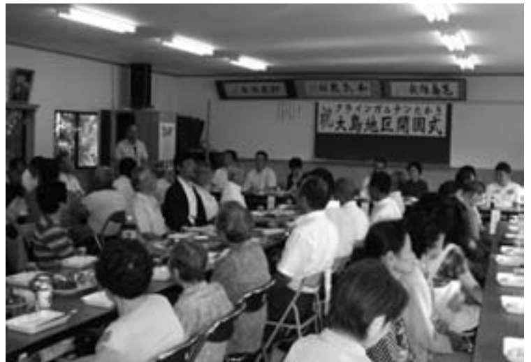
大島地区での開園式 (8月27日)