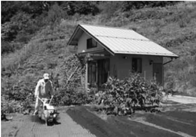
クラインガルテンで農業を楽しむ利用者

編集 企画財政課／発行 喬木村役場 TEL 0265-33-2001 FAX 0265-33-3679 印刷 龍共印刷株式会社 (飯田市上郷黒田121-1)