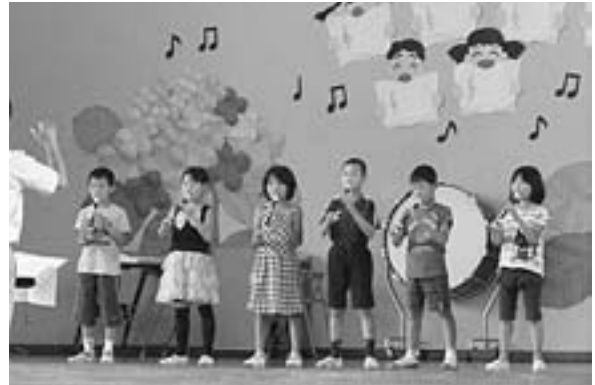
音楽会で「あの雲のように」「メリーさんのひつじ」などを発表（3年 7/1）