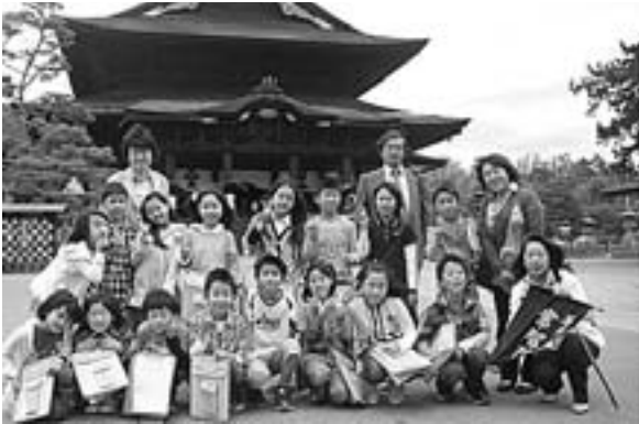
見るもの全てが新鮮！ 驚きの連続！ 楽しかった長野社会見学（4年 6/2）