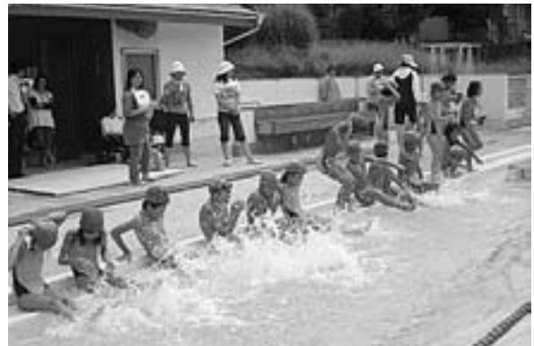
今シーズンの練習の成果を発表し合った 水泳まとめの会（8/26）