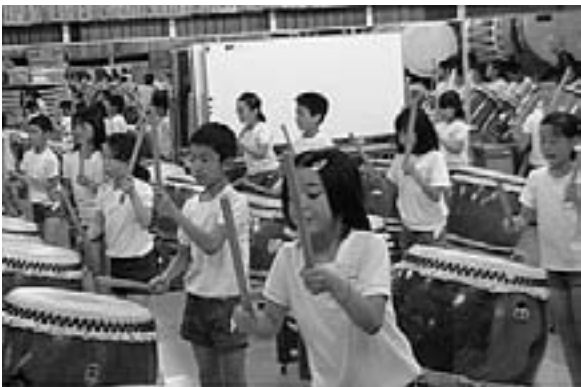
今年から銀嶺太鼓に挑戦している4年生！ 岡谷の御諏訪太鼓で練習（4年 7/15）