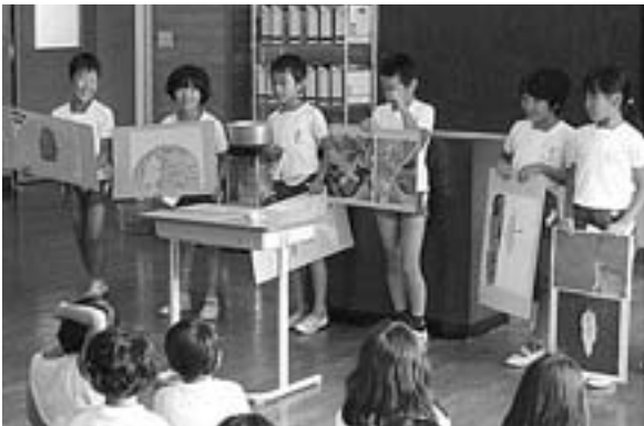
モンシロチョウの観察をしてわかったことを 1学期終業式で発表（3年 7/26）