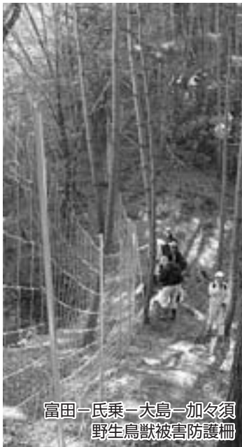
富田一氏乗一太島一加々須 野生鳥獣被害防護柵

ふるさと寄付金 (平成20~22年度) 総額 4,539,083円 (207件・148名)