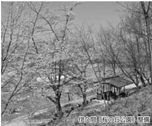
伊久間「桜の丘公園」整備

各地区的自主的、創造的な取り組みを支援するために交付する自治振興交付金、活性化創造支援金など、村の活性化のため有効に活用させていただきますました。 引き続き、ふるさと寄付金について、ご協力をお願いします。 なお、平成二二年度にご寄付をいただいた方のうち、氏名の公表をご了解いただいた方について、次のとおりご紹介させていただきます。