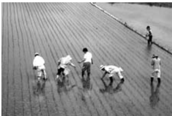
緑に囲まれた楽しい暮らし