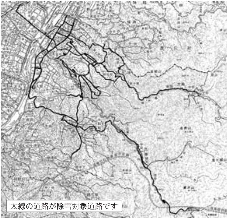
太線の道路が除雪対象道路です

凍結防止剤は、地区の公共施設や村内道路へ設置してある塩カルボックスへ常備してありますので、必要なときにお使い下さい。凍結防止剤に不足が生じましたら役場に用意してありますので、地区の役員の方は必要数をお申し出下さい。冬季の道路は、日陰部や橋の上など雪が降っていないにもかかわらず凍結している場合がありますので特に注意してください。