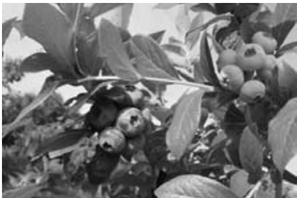
ブルーベリーのケーキはいかが