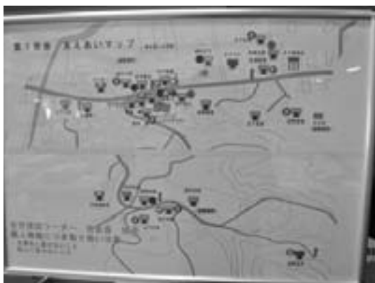
富田区 支え合いマップ