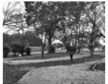
マレットゴルフコース