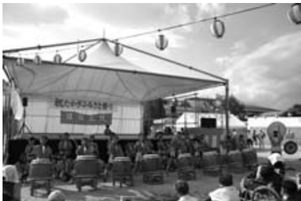
ふるさと祭りの銀嶺太鼓