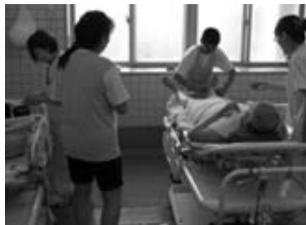
●下伊那厚生病院。入浴の補助をさせていただきました。