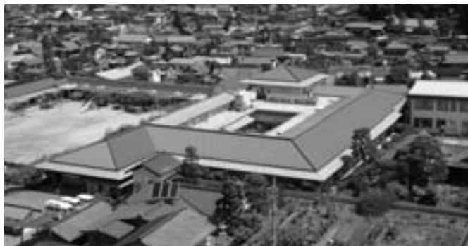
改修が進む 特別養護老人ホーム『喬木荘』

昨年は当地方は大きな台風の通過もなく平穏な一年でありましたが、秋の山の幸が例年になく不作でした。一方特産の市田柿は大豊作となり、加工資材も不足するほどで、この方はよかった一年でした。一昨年発生した東日本大震災、県北部栄村を中心とした地震・津波、また原発の事故により未だ故郷には帰れず、特に放射能による被害はいつ収束するのか、一日も早い元の生活に戻ることを願うものです。しかし、この震災で社会や人の結びつきが大切だと思ふようになったという人が多くなり、私達の求める幸せの形が変わりつつあるように思われます。昨年はロンドンオリンピックが開催され、日本選手の好成績に国中が元