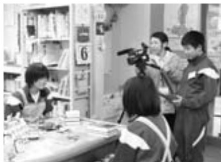
●棕図書館での実習を取材し、番組づくり。(くりんネットたかぎ)