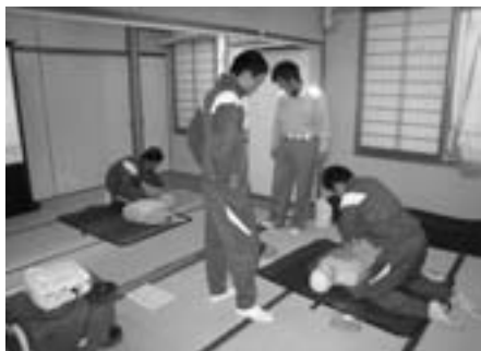
●飯田広域消防高森分署では、普通救命講習の修了証をいただきました。