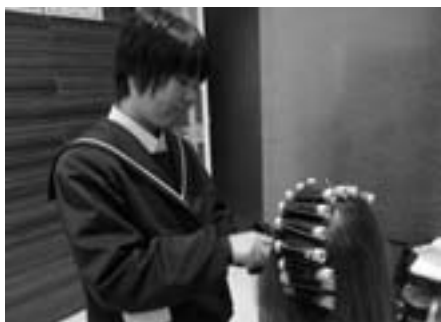
●卑弥呼美容店でセットの練習をさせていただきました。

喬木中学校2学年(67名)では、11月6日(火)・7日(水)の2日間にわたって、村内・豊丘村・高森町・飯田市の29事業所において職場体験学習をさせていただきました。