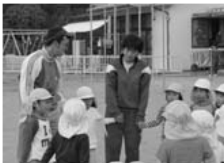
●中央保育園。安全に注意しながら、園児としっかり遊びました。