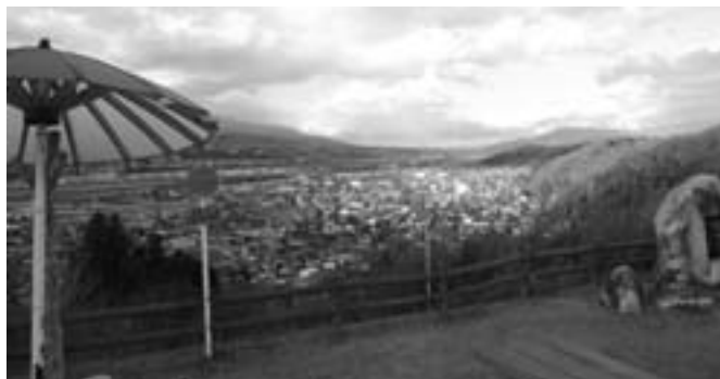
中原よりリニア中央新幹線 予想ルートを臨む

説明させていただきましたが、順調に経過しており、予定されておりましたデジタル移動系防災無線整備事業もそれぞれご理解をいただき、年度内完成を目指して進めております。昨年完成し、村内五箇所で観測を行っている雨量観測システムも合わせ、災害に強いむらづくりを目指しております。災害応援協定につきましても、村内事業所や飲料水確保のために各メーカーとも協定を締結することができました。特養喬木荘の大規模改修についても順調に進めており、住宅リフォーム補助金につきましても、多くの皆様にご利用いただいております。厳しい財政事情ではありますが、安定してきめ細やかな村政運営を心がけて進めております。