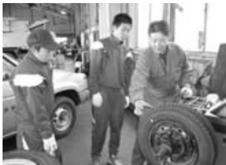
●大蔵自動車さんでは、車の整備について学びました。