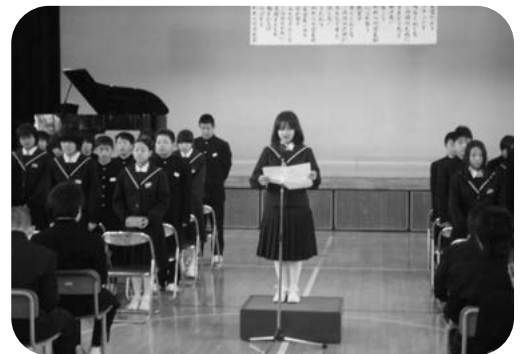
4月7日 学友会入会式

学年目標で一致団結をします。 学年目標 「文 もっ を以て友を会す」 ・・・論語 (学問を基にして友を集める。それが修養を基本とする君子の交わりである。)