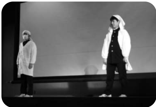
上級生が部活動説明会を開いてくれました