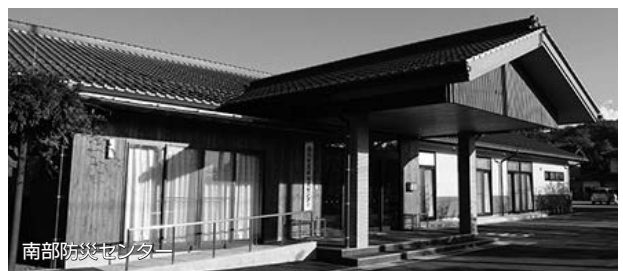
南部防災センター

事業内容等の詳細は『平成25年度わかりやすい決算書』で確認できます。（ご希望の方には企画財政課で無料配布しています。）