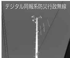
デジタル同報系防災行政無線