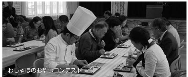
わしゃほのおやつコンテスト