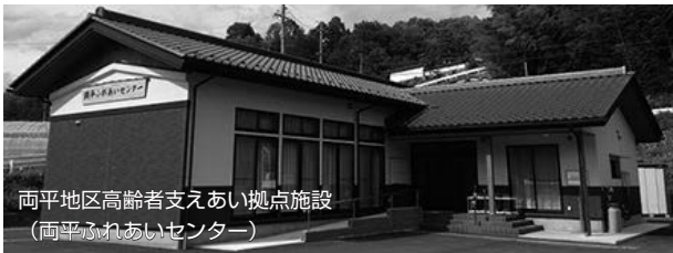
両平地区高齢者支えあい拠点施設 (両平ふれあいセンター)