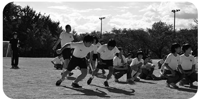
運動会・全校リレー