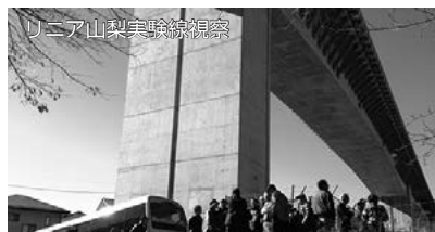
リニア山梨実験線視察