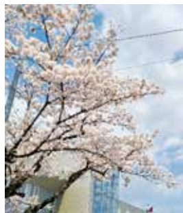
3月30日のソメイヨシノ

右写真は、3月30日の役場のソメイヨシノ。例年より10日ほど満開が早かった。4月は、サクラムもモモもナシもチューリップもみんな一気に咲いて、短い時間のなかで散っていった感がある。