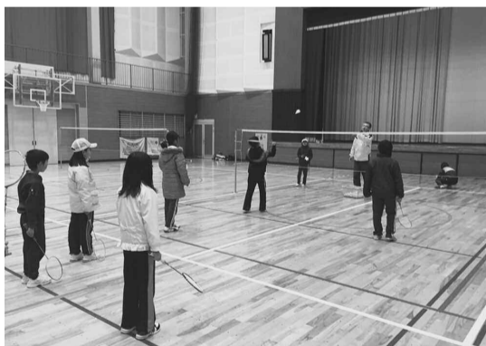
初回のジュニアレッスンは約10名でスタート

を好きになってもらえるよ うに、のびのびクラスのス クールです。 サークル練習会は、同好 の老若男女で、木曜日十七 時三〇分から二時間、中学 校体育館で行っています。 アップを兼ねた基礎打ちの あとダブルス形式のゲーム をしています。楽しくがモツ トの練習会です。 気軽に楽しむことができ るバドミントン。是非一度 ご参加ください。