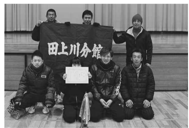
男子Bブロック 優勝 田上川