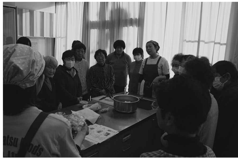
高野豆腐を使ったおやつ作りの指導を受ける参加者のみなさん

真冬の大変寒い時でし たけれど、天候に恵まれ、 多くの方が参加出来たこ とはよかったです。 人生百年と聞かされて来 る今の時代を、女団連では 「むらの保健室」として、 盛沢山の内容で取組まれ ました。講師の先生から 「健康で村づくり」と題 し、八年後は四人に一人 が七五才以上と云う超々 高齢化社会を迎える中、 喬木村は「取組んでいっ たらよいか？」アドバイ スされました。全体の感 想としては村全体の社会 福祉、介護、その他中広 い皆さんにも出席してい ただけたらよかったです。 と思います。