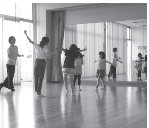
アスポスタジオで活動するジュニアクラス

「みんなの広場アスポ」を拠点とするたかぎスポーツクラブ。昨年度の会員数は過去最高の五百二十名となり、ゆつくりではありませんが、順調に成長しています。今年度も昨年より約五十名多い会員数で推移中。今回はそんなたかぎスポーツクラブで