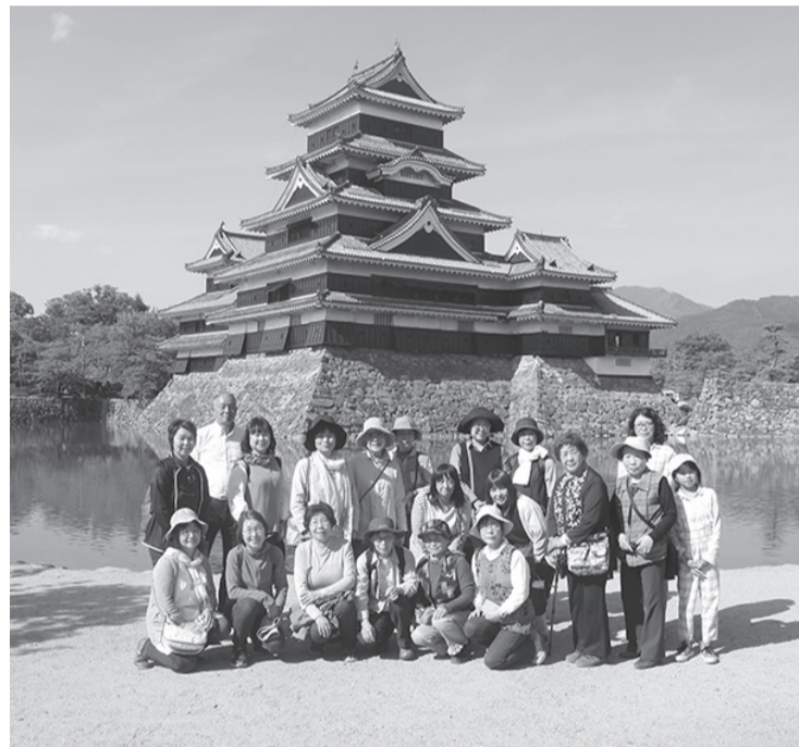
松本城にて記念撮影

く、標高の高さを身もつて知りました。そこから山を下り一時間三十分、もう一つの目的の地松本城に着きました。さすが国宝、お城に入る前からたくさんの人の行列、外国の方も大勢です。そして狭くて急な階段をいくつも登って、天守に到着。さっきまでいた