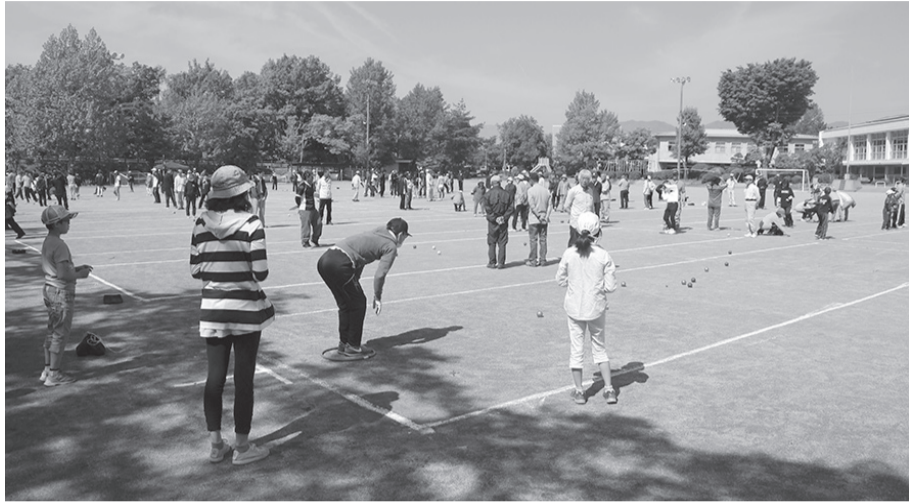
44チームによる熱い戦いが繰り広げられました

五月十二日(日)、喬木第一小グラウンドを会場に分館対抗パタンク大会が開催されました。今年、十三分館四十四チームが参加し、八つのブロックに分かれて熱戦が繰り広げられました。天候にも恵まれ、初めての方も含めて老若男女が混合のチームで試合を楽しむことができました。結果は次の通りです。