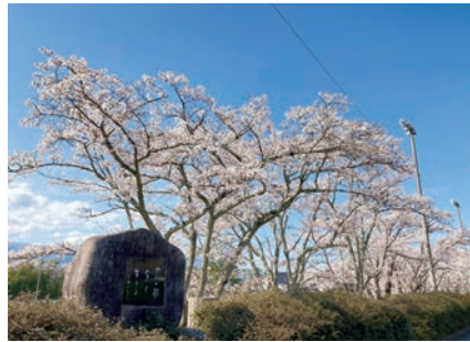
第一小学校横の石碑と桜