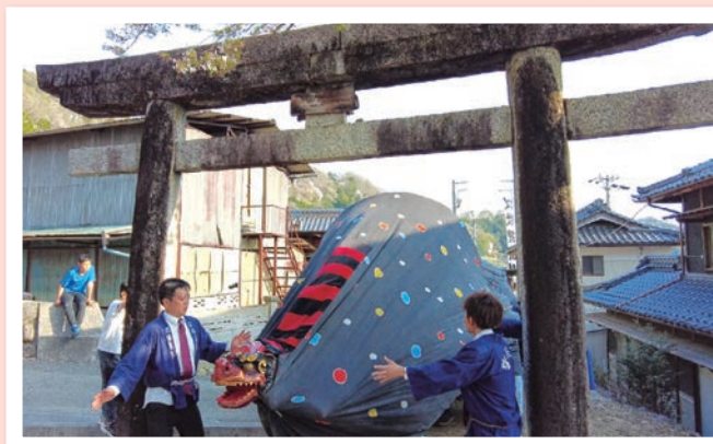
伊久間 「伊久間諏訪社」 4月14日(日)