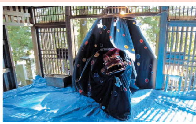
馬場・両平 「韓郷社」 4月14日(日)