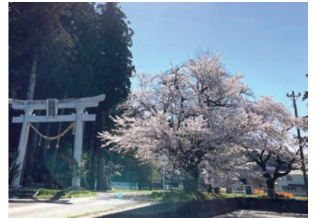
八幡様の鳥居と桜