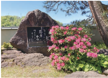
玄関前の石碑としゃくなげ