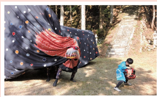
加々須 「大宮諏訪社」 4月14日(日)