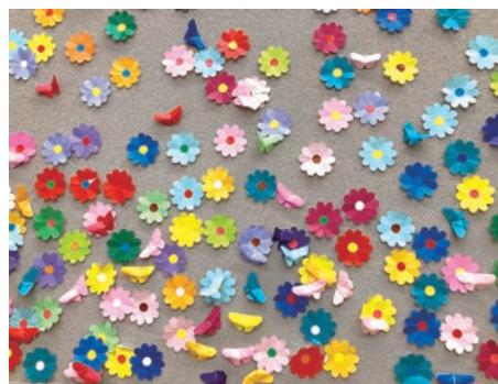
春の野原はカラフルです！

本を借りると参加できる「壁面」ですが、3月から4月にかけては「花と蝶々」を貼って春の野原を賑やかにしてもらいました。貼るのを楽しみに来てくれる子どもさんも多く、嬉しい限りです。