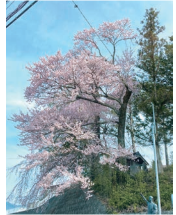
中央社会体育館南側の枝垂れ桜

また図書館では、6月7日(金)に昨年久しぶりに開催して好評だった「ぬいぐるみおとまり会」を予定しています。詳細はHP、Facebookなどでご確認ください。