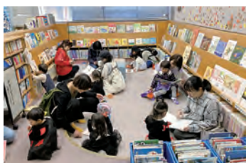
親子で読み聞かせ