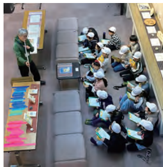
館長の説明を聞く3年生