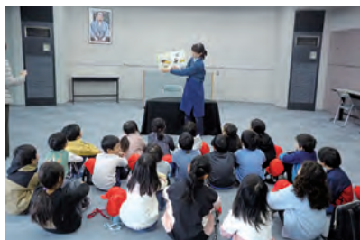
おはなし会を楽しむ1年生