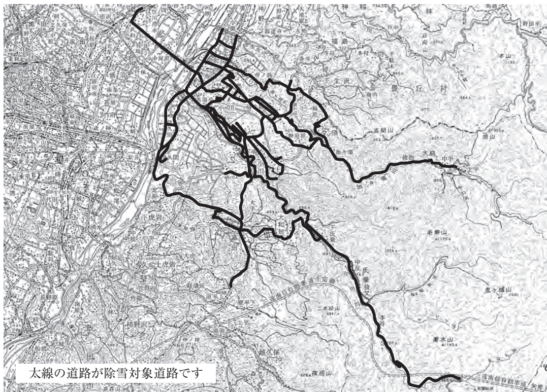
太線の道路が除雪対象道路です

融雪剤は、必ず除雪を行った後に散布してください。降雪時や積雪状態での散布では効果が期待できません。また、散布の際は直接手で触れないようにしてください。