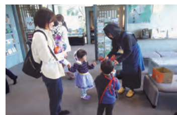
プレゼントをどうぞ