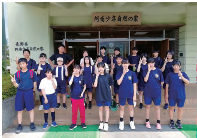
<1組 自然の家玄関にて>