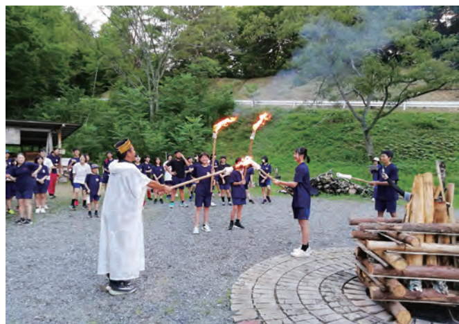
<キャンプファイヤー>

1年生が阿南少年自然の家にて、1泊2日で自然体験学習に行ってきました。両日ともなんとか天候に恵まれ、1日目は、野外炊飯やウォークラリー、キャンプファイヤーを行うことができました。野外炊飯では、かまど、カレー、飯盒と役割をみんなで分担しながら美味しいカレーを作ることができました。2日目は、マレットゴルフやキーホルダー作りができ、阿南の大自然を肌で感じながら充実した2日間を過ごすことができました。