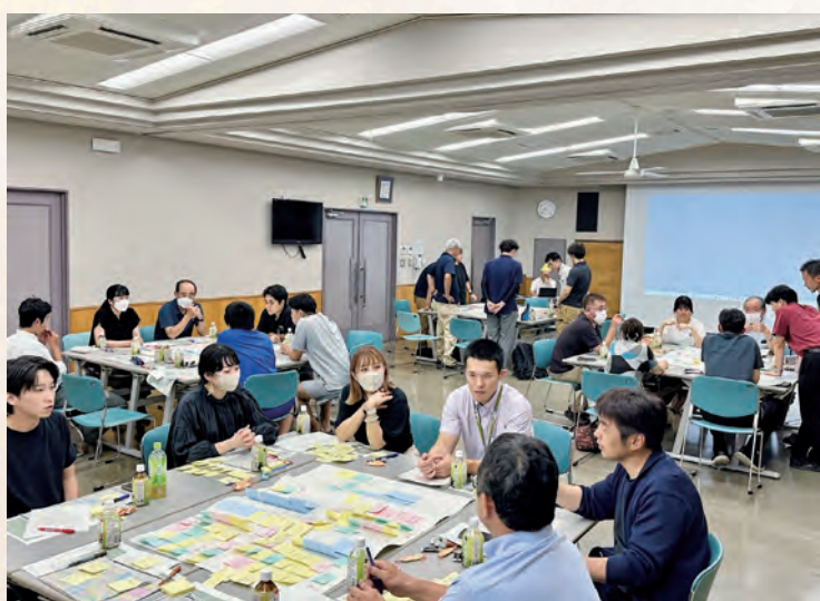
▼むらづくりワークショップの様子

年度の取り組みとして、リニア・三遠南信時代を見据えた村づくりの構想を示すグラフィックデザインの骨子案を作成しています。