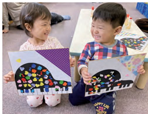
じょうずにできたよ！(絵本の会)