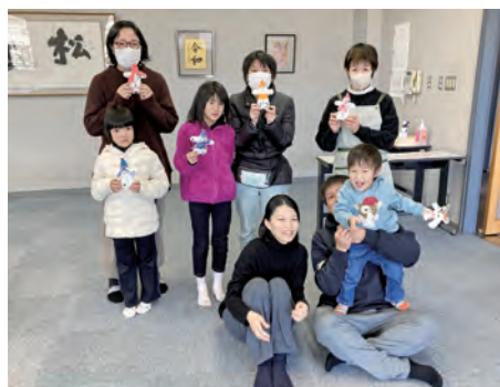
すてきなスノーマンができました