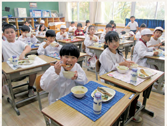
▼マツタケを美味しくそうに頬張る児童たち

村としましてもこうした異常気象を引き起こす原因とされている環境問題も含め、対応を検討していく必要性も感じているところではあります。