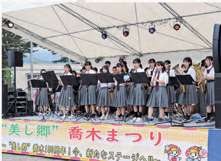
▼喬木まつりの様子