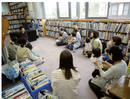
おはなし会楽しいね(おはなしのへや)