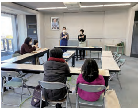
真剣に綿を詰めています