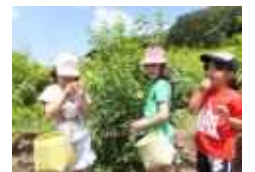
ブルーベリー観光