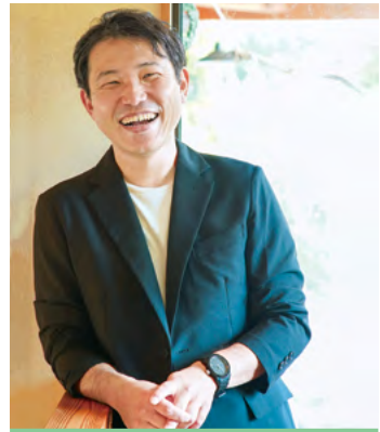
地域おこし協力隊 福岡県久留米市出身

喬木村では、事業者さんや農家さんと一緒に、特産品のPRやイベントのサポート、中学生とのワークショップ、AIを活用した業務改善などに取り組んでいます。