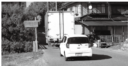
③下条米川飯田線 弁天橋境の沢川橋周辺