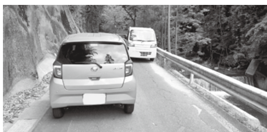
①一般県道上飯田線