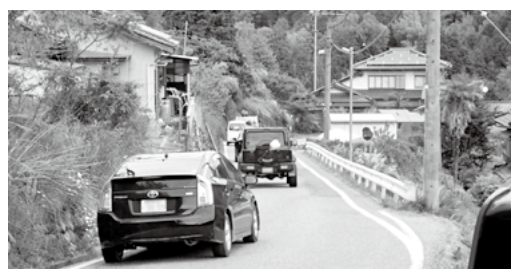
②下条米川飯田線 富田バイパス