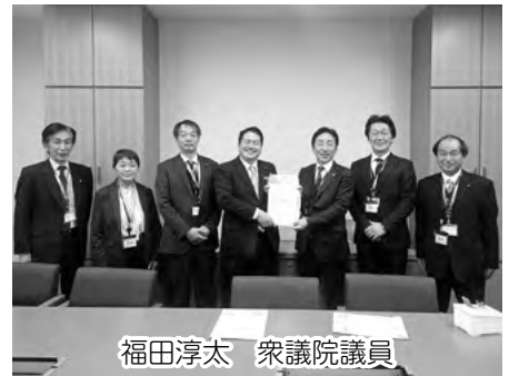
福田淳太 衆議院議員