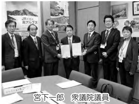
宮下一郎 衆議院議員