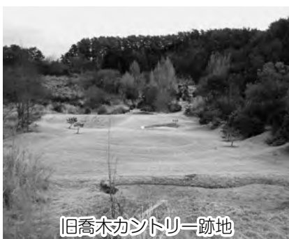
旧喬木カントリー跡地