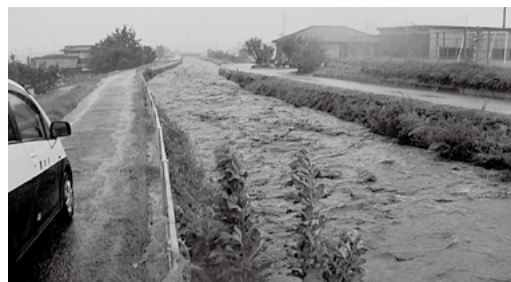
④台風時の増水した壬生沢川