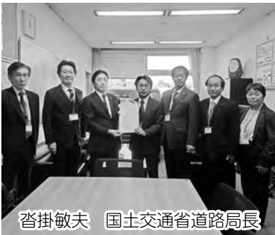
沓掛敏夫 国土交通省道路局長