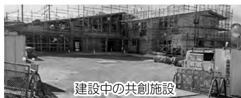
建設中の共創施設

A 民間事業者指定管理をお願いすることを検討している。指定管理は契約が3年から5年で、包括的な施設管理が可能であり、現在どの事業者指定管理をお願いするか検討中。施設の維持管理費は年間1,000万円ほどと試算している。